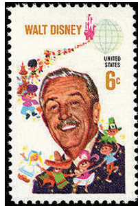
WALT DISNEY (1901-1966)

İşte gerçekleşen amacının iki küçücük örneği: Mersin'den 85 yaşındaki bir diyabetli şunları yazıyordu: "Sizler ne kadar yüce evlatlarsınız ki, başkalarını düşünüp böyle güzel bir işe girişmişsiniz. Hepimiz adına sizlere teşekkür ediyorum. Ben de Denge dergisini okumak istiyorum." Bir de Aydın'dan, hapishaneden etkileyici satırlar yazan bir mahkûm vardı. Denge onun da hastalığı hakkında bilgi sahibi olmasına aracılık etti.