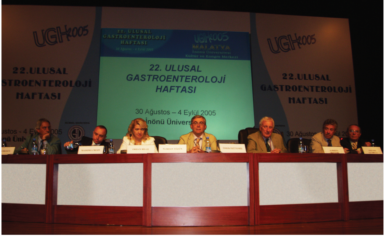
Ulusal Gastroenteroloji Haftası, 2005, Malatya