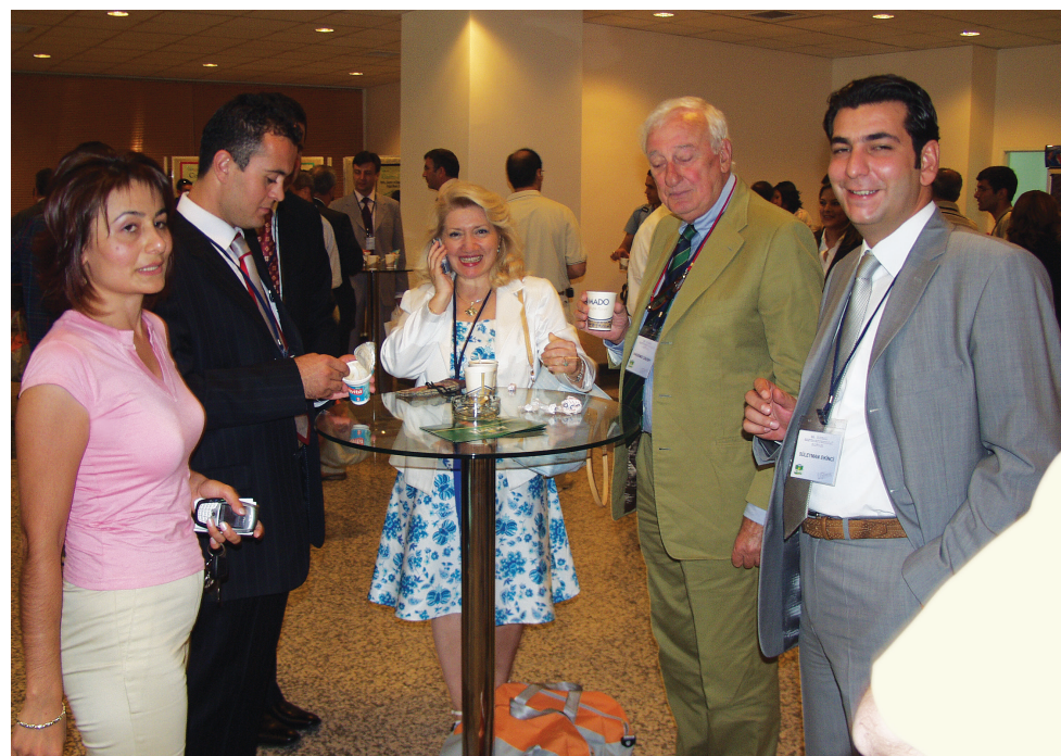
Ulusal Gastroenteroloji Haftası, 2005, Malatya

Program hazırlamak yeterli değildir. Onun eksiksiz uygulanması, uygulanmadığında da bunun bir yaptırımı olması gerekir. Türk Gastroenteroloji Derneği Yeterlik Komisyonu'nun uzun çabalar sonucu geliştirdiği uzmanlık eğitim programı ülkemizde gastroenteroloji eğitimi veren kaç merkez tarafından uygulanmaktadır? Asistan karnesini hakkıyla uygulayan kaç merkez vardır? Uzmanlık öğrencilerine düzenli olgu sunumu, seminer, multidisipliner toplantı (radyoloji, patoloji, cerrahi vb.) olanağı sunan, kongrelere katılmasını sağlayan, öğrencinin bilgi ve becerilerini doğru bir şekilde ölçen ve değerlendiren, yayın yapmasını güdüleyen kaç ihtisas merkezi saya-