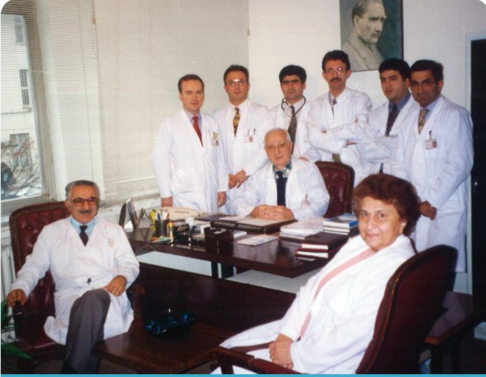
Istanbul Üniversitesi Çapa Tıp Fakültesi Gastroenterologları