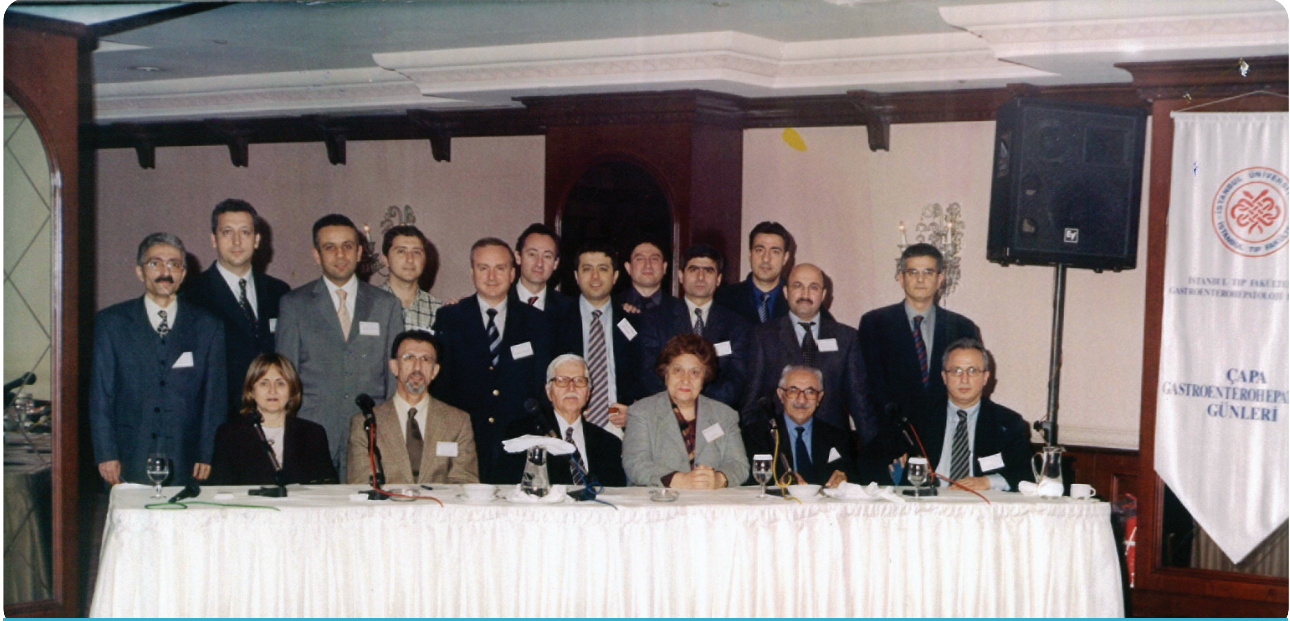
Çapa Gastroenteroloji Günleri

Türkiye'deki tıp fakültelerinde akademik yaşamın ve eğitimin 21. Yüzyıla yaraşır bir hale getirilmesi için her şeyden önce, üniversitelerin sayısından çok kalitesinin artırılması önem taşımaktadır. Ancak tıp eğitiminin kalitesi arttığı zaman Türk tıbbının ufukları aydınlanabilecektir.